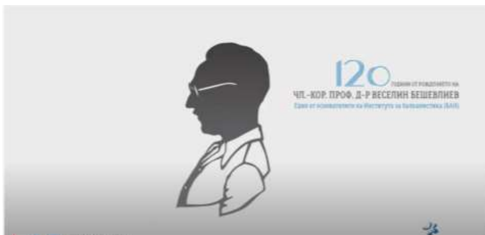
Начален кадър на изложбата